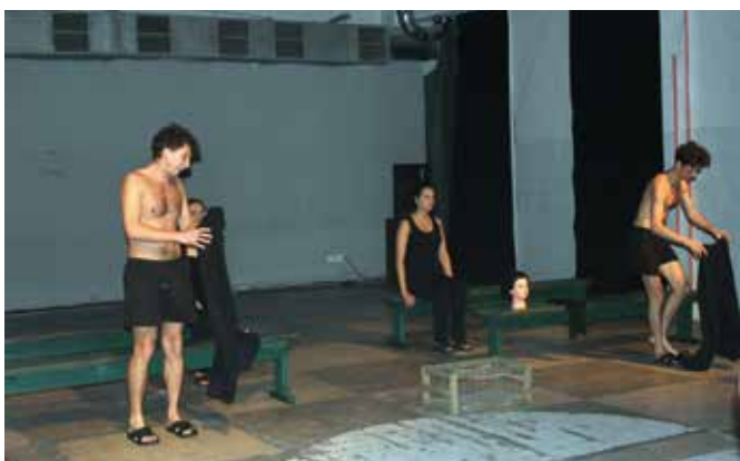
Actorii Teatrului național „Mihai Eminescu” au transpus trăirile și experiențele deținuților din sistemul penitenciar din Moldova în spectacolul „Shakespeare pentru Ana”, montat pe scena centrului de artă Tipografia 5 din Chișinău.