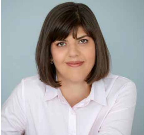
Laura Codruța Kövesi