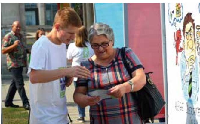
Centrul Național Anticorupție informează cetățenii despre riscurile corupției prin intermediul unor campanii publice periodice cu participarea tinerilor și autorităților locale.