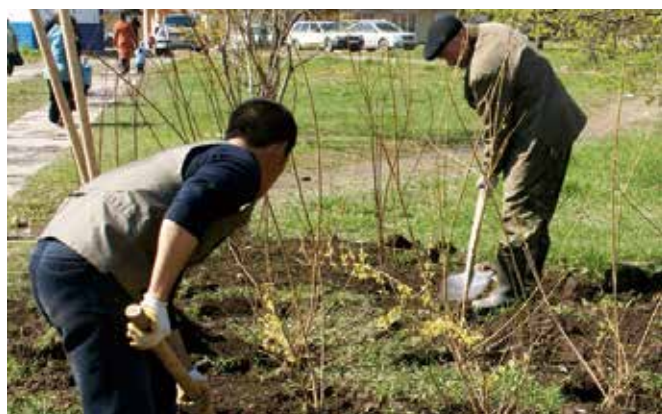
Persoanele liberate de pedeapsă participă la lucrări comunitare și muncă în folosul societății – o măsură alternativă pedepselor private, ce permite oamenilor să se reintegreze mai ușor în comunitate.