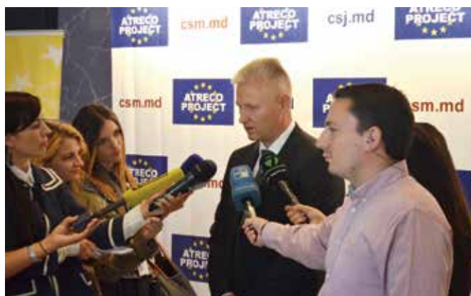
Judecătorii moldoveni se vor ghida de un nou cod de etică, aprobat la Adunarea generală a judecătorilor din 11 septembrie 2015, care are menirea de a restabili solemnitatea profesiei și încrederea oamenilor în justiție.