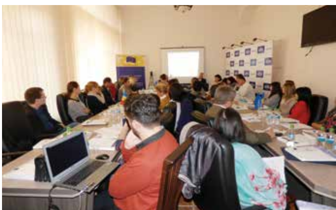
Instanțele judecătorești vor avea, în premieră pentru Republica Moldova, judecători purtători de cuvânt, instruiți să faciliteze comunicarea instanțelor cu publicul și mass-media.