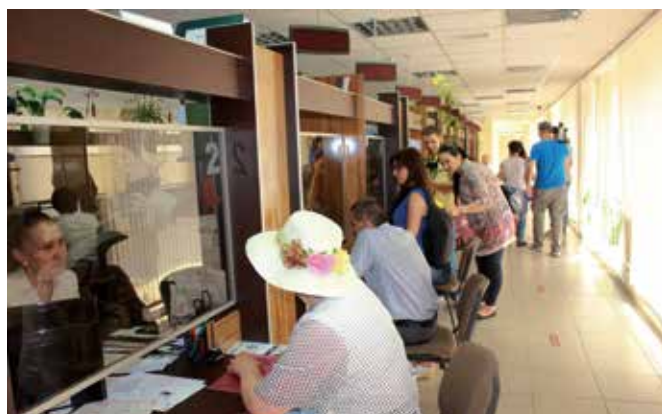
Din iunie 2015, moldovenii pot accesa mai multe servicii de stare civilă prin intermediul rețelei de ghizee multimedia.