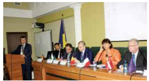
Congresul UNEJ din 17 septembrie 2015