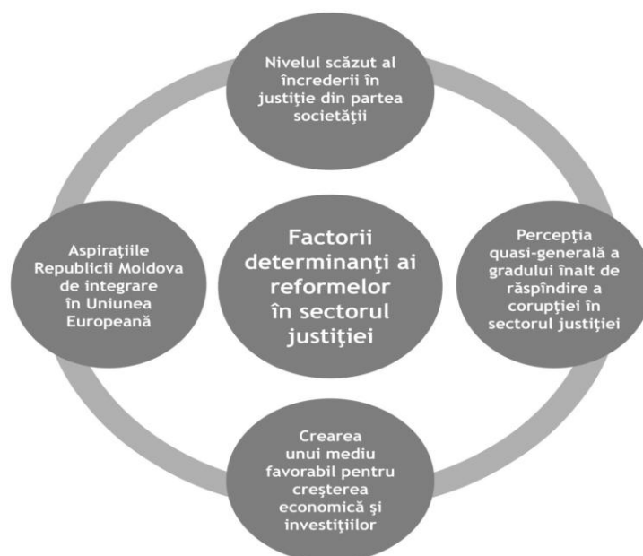
Figura 1: Factorii determinanți ai reformelor în sectorul justiției

Factorii determinanți ai reformelor sînt prezentați grafic în Figura 2 și descriși detaliat mai jos.