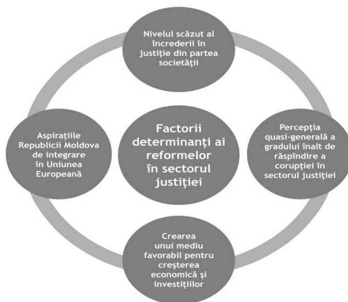
Figura 1: Factorii determinanți ai reformelor în sectorul justiției

Factorii determinanți ai reformelor sînt prezentați grafic în Figura 2 și descriși detaliat mai jos.